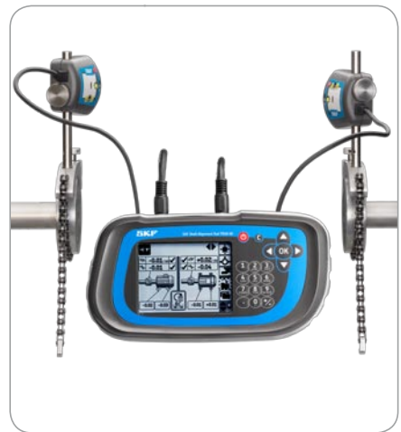
簡単な結果の保存