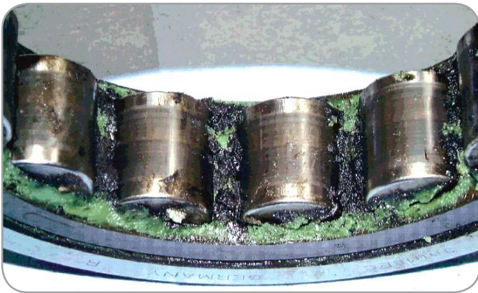
放電による潤滑油の分解